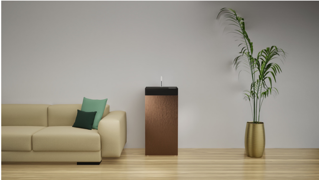
※2025年8月より発売予定のAQ-20X

空気製水機は、空気清浄したきれいな空気から水分を効率よく吸着し、さらに高性能浄水フィルターで浄水した後にバイオミネラルフィルターでミネラルを添加するので、安全でおいしい飲料水を製水します。水道法51項目の水質基準をクリアする水質で、電気さえあれば飲料水を得られるので、平時だけでなく、災害時においても活用することができます。